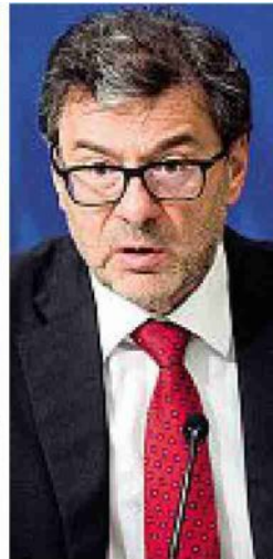
A sinistra il segretario generale della Cgil Maurizio Landini. A destra il ministro delle Finanze, Giancarlo Giorgetti