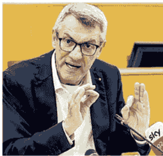
MAURIZIO LANDINI SEGRETARIO GENERALE DELLA CGIL