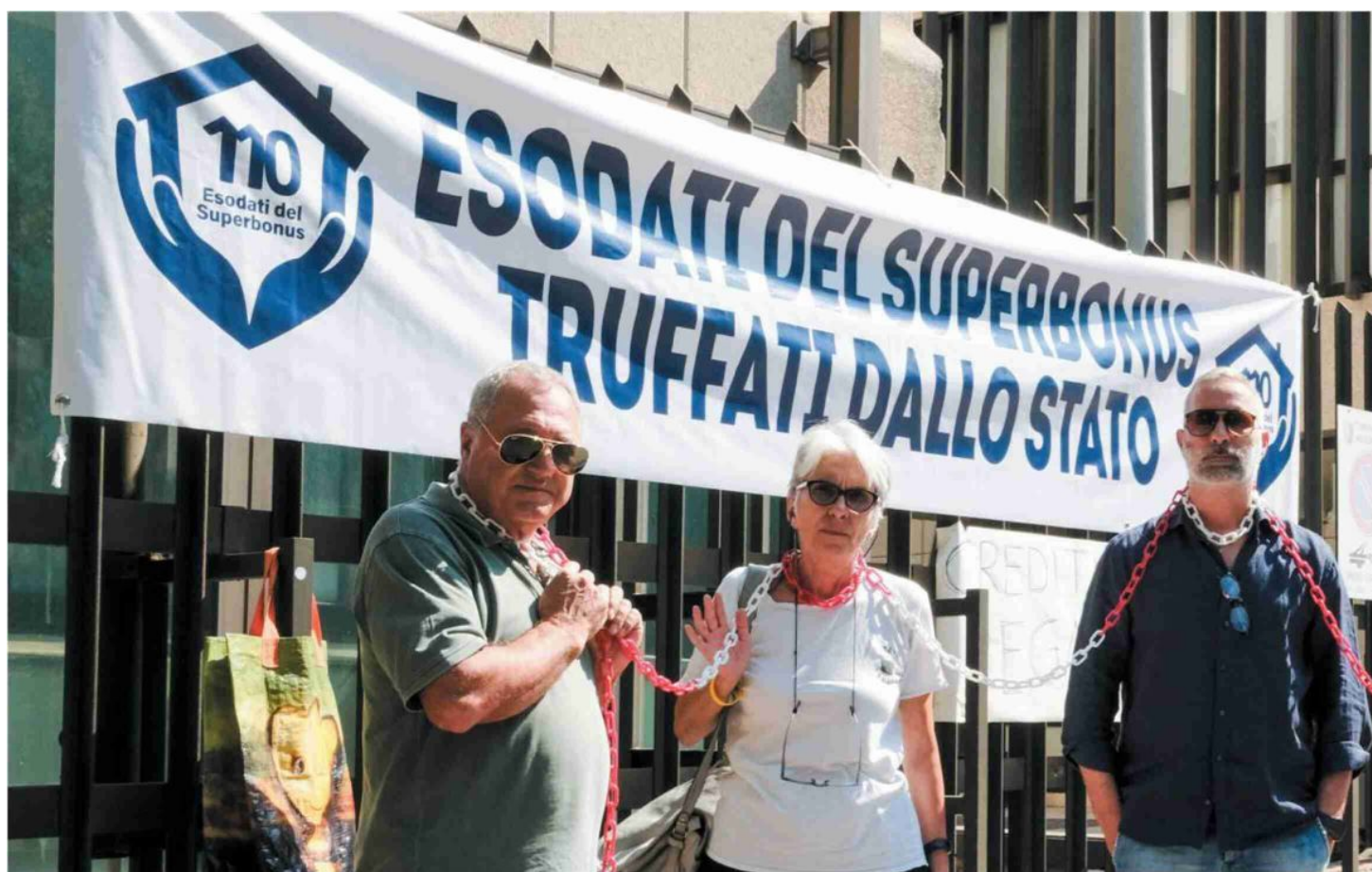
Gli esodati del superbonus protestano davanti ai palazzi delle istituzioni. Nella foto a destra, il ministro Francesco Lollobrigida

ste attività ad altri soggetti, società o enti, che cercano così di ridurre il loro debito con il fisco. Intesa, per esempio, si è liberata di crediti per oltre 10 miliardi. Lo stock più importante, per un valore di circa 1,3 miliardi, è stato venduto nel dicembre scorso al gruppo petrolifero Ludoil della famiglia Ammaturo. A giugno, la stessa Ludoil ha comprato un altro stock da 600 milioni da Bper. La conferma, semmai ce ne fosse bisogno, che il disastro superbonus per qualcuno si è già trasformato in un grande affare.