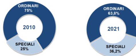
APPALTI PUBBLICI PER LAVORI Composiz.% del valore a base di gara (bandi e inviti di importo ≥40mila€) per tipologia di settore