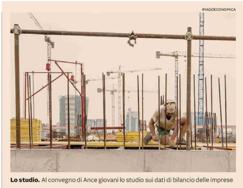
Lo studio. Al convegno di Ance giovani lo studio sui dati di bilancio delle imprese