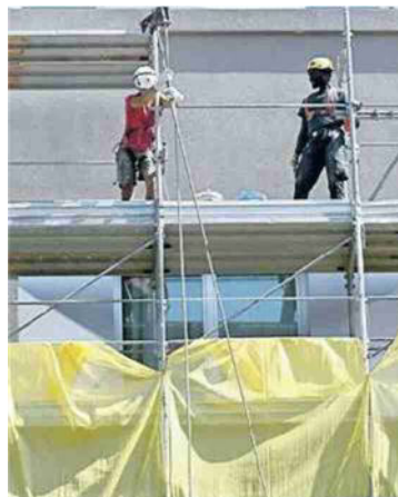
Un cantiere per la ristrutturazione di un condominio

VALGONO 10 MILIARDI I LAVORI NON ANCORA TERMINATI OGGI ALLA CAMERA L'AUDIZIONE DI ANCE E CONFEDILIZIA