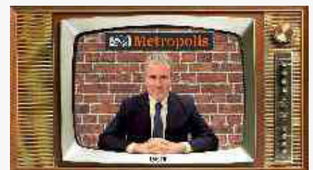
Metropolis/479 - "Odio, patria e