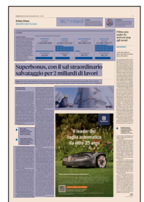
Peso: 1-1%, 9-52%

In questo quadro, poi, non è ancora completamente chiusa la porta di una proroga breve. Si tratta di una strada della quale continua a parlare soprattutto Forza Italia, a partire dal vicepremier Antonio