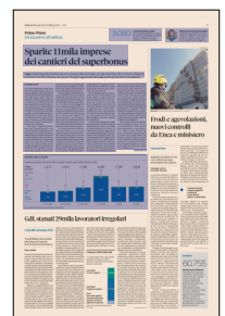
Peso: 1-6%, 5-37%

Questi obblighi, però, sono pienamente in vigore solo da luglio 2023 e hanno iniziato a svolgere i primi effetti a gennaio del 2023. Per la presidente Ance Brancaccio, sono stati tempi troppo lenti: «Si è trattato di una misura blanda e tardiva, perché ha riguardato solo i lavori sopra i 516mila euro ed è arrivata solo quando i buoi erano già scappati dalla stalla». Cioè, quando i lavori erano stati già distribuiti sul mercato a soggetti