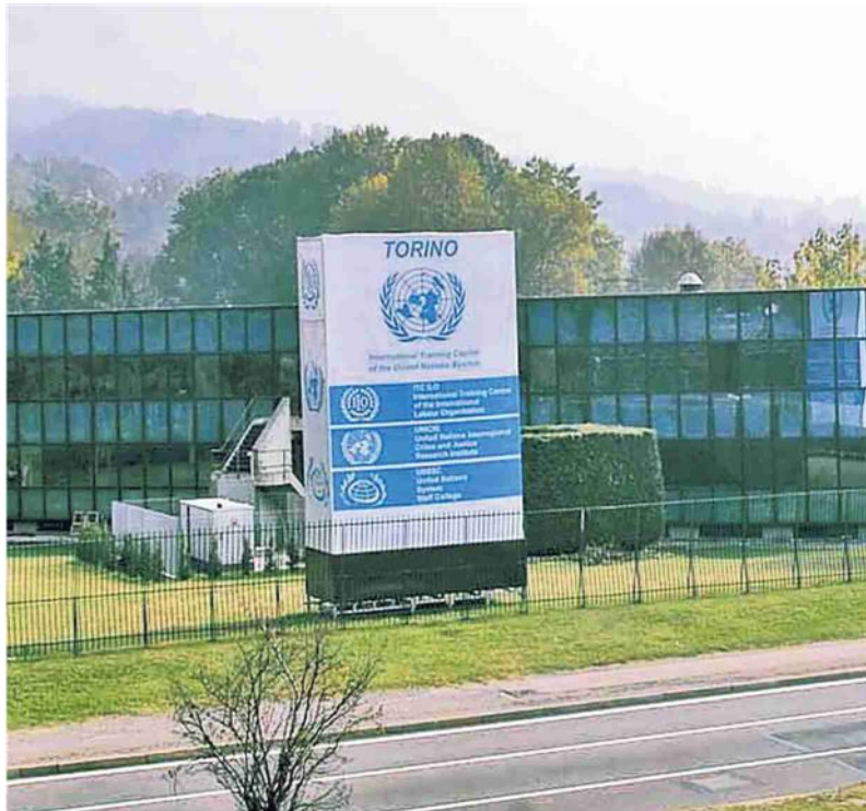
▲ Il campus delle Nazioni Unite È qui la sede del Training center dell'Ilo