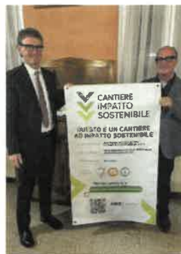
Zuccherofino Costruzioni sas di Cremona

Il nuovo anno si annuncia ricco di iniziative di grande rilievo.