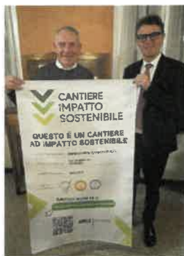
Vago Costruzioni srl di Cremona