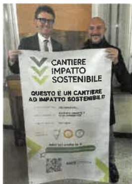
Edilsuolo srl di P. L. Beltrami di Cremona

L'associazione ha consolidato il proprio ruolo di protagonista: ANChEDONNA e Cis progetti chiave. Nel 2026 in programma le celebrazioni per gli 80 anni di fondazione. Fronteggiare le sfide in vista