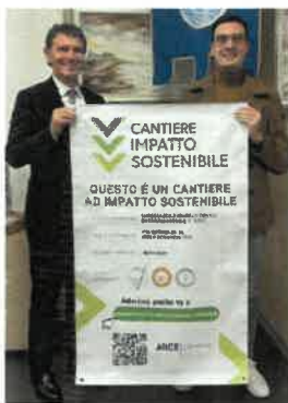
Impresa Edile Fratelli Ceriari snc di Derovere