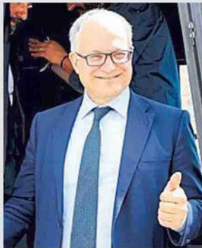
Roberto Gualtieri (Roma)