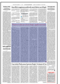
Peso: 1-30%, 4-35%

agricole attraversano una fase assolutamente critica. L'aumento dei costi di produzione è senza precedenti. La siccità sta riducendo i raccolti e servono misure urgenti per salvaguardare le produzioni e contrastare la crescita dei prezzi al consumo. A livello internazionale, avanza una crisi alimentare globale. In queste condizioni, abbiamo assolutamente bisogno di stabilità e di un governo pienamente operativo all'interno e autorevole a Bruxelles e nei consessi internazionali". (segue a pagina quattro)