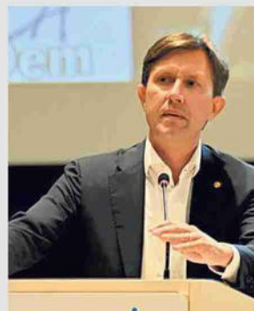
Dario Nardella (Firenze)