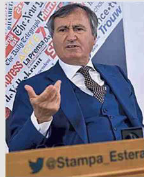
Luigi Brugnaro (Venezia)