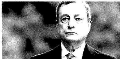
Premier. Mario Draghi