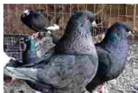
Brisighella: Colombi in mostra all'Ex Convento dell'Osservanza