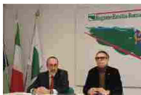
Turismo: in Emilia Romagna 300 milioni per riqualificare gli alberghi

Articoli correlati Di più dello stesso autore