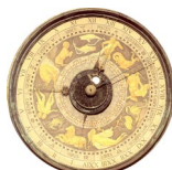
Ordine degli Ingegneri