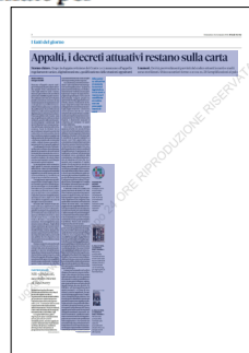
Peso: 1-3%, 2-33%

Non tutto è immobile. Quando qualcosa di utile si è cercato di fare, come nel caso del regolamento unico, affidato al sottosegretario Salvatore Margiotta, il tentativo si è fermato per